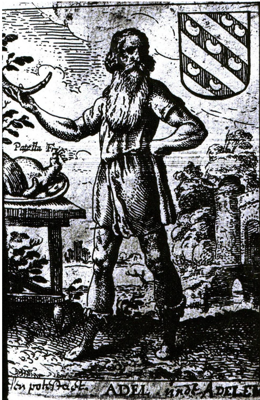
Desen Potestadt. ADEL oudt ADELEN

Knipsel uit notitieboekje van Adriaan Westphalen, Kon. Bib. Brussel, Hs 19219, blz 137.